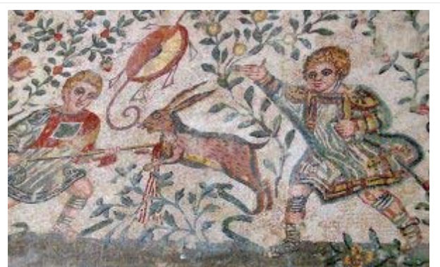
Kinderen jagen op een konijn in een veld, mozaïek in Villa Romana del Casale, Pompeï

In het licht van deze opvattingen zou de parabel van de kinderen op het veld kunnen draaien om het verzaken van de stoffelijke wereld. Het veld zou in dat geval staan voor de aardse wereld, terwijl de kleding het fysieke lichaam representeert (vgl. logion 37). Het begin van de parabel beschrijft de uitgangssituatie van de mens: Net als de kinderen verblijven de mensen in de stoffelijke wereld, maar, door hun geestelijke kern (lichtvonkje), behoren ze er niet toe. Het slot van de parabel gaat over het gnostisch ideaal om, net als de kinderen, de wereld op te geven en de genoegens/behoefte van het fysieke lichaam te verzaken. Hierdoor kan men zich op de (naakte) geestelijke kern richten. Alleen het middendeel is lastig te begrijpen: Hoe zouden we de komst van de eigenaars moeten interpreteren? Mogelijk gaat het om een keuzemoment waarbij de mensen moeten kiezen of ze zich aan deze wereld willen blijven vastklampen of niet. De veronderstelling zou kunnen zijn dat de oproep om de stoffelijke wereld te verzaken ("ruim het veld") weerstand oproept bij de mensen.